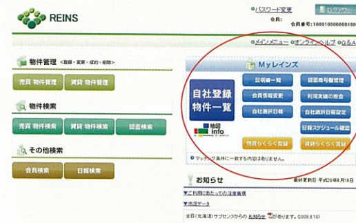
レインズIP型トップ画面